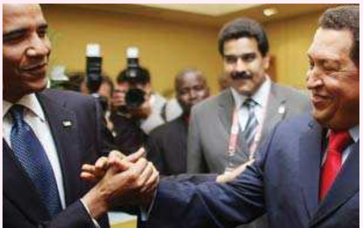
ചരിത്രം തിരുത്താൻ, ഐക്യത്തോടെ : യുഎസ് പ്രസിഡണ്ട് ബറാക് ഒബാമയും വെനസ്വേലൻ പ്രസിഡണ്ട് ഹ്യൂഗോ ഷാവേസും

അതേ, ക്യൂബ ഇന്നും വാർത്തകളിൽ നിറഞ്ഞുനില്ക്കുകയാണ്.