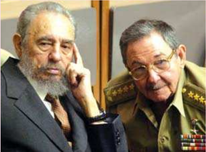
ഫിഡൽ കാസ്ത്രോയും സഹോദരൻ റൗൾ കാസ്ത്രോയും

ഇക്കാലത്ത് ഒരു നിയമവിദ്യാർത്ഥിയായിരുന്ന ഫിഡൽ കാസ്ത്രോ ബതിസ്റ്റയ്ക്കെതിരെ യുവാക്കളെ സംഘടിപ്പിച്ച് ഒളിപ്പോരുമായി രംഗത്തിറങ്ങി. ബതിസ്റ്റാ ഇവർക്കെതിരെ ക്രൂരമായ മർദ്ദനമുറകൾ അഴിച്ചുവിട്ടു.