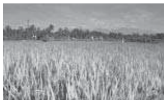
ബീയം പോലുള്ള വൃക്ഷങ്ങളും വച്ചുപിടിപ്പിക്കാം.

കേരളത്തിന്റെ അങ്ങോളമിങ്ങോളം നെല്പാടങ്ങൾ വർഷങ്ങളായി തരിശായിരിക്കുന്നു. അത് ഗുണപ്രദമായി ഉപയോഗിക്കാൻ വേണ്ട ഒരു നടപടിയും മാറിമാറിവരുന്ന സർക്കാരുകൾ സ്വീകരിക്കുന്നില്ല. ഇപ്പോഴത്തെ സാഹചര്യത്തിൽ തരിശുനിലങ്ങളിൽ ഉടനെ ആരും നെല്കൃഷി ചെയ്യട്ടെ.