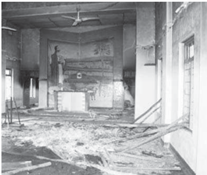
ഒറിസയിൽ അക്രമികൾ തകർത്ത ദേവാലയം

കവികളെ നമ്മുടെ ഒരു കവി തന്നെ രൂക്ഷമായി പരിഹസിക്കുന്നുണ്ട്. അതു സിപിഎമ്മിന് നന്നേയിണങ്ങും. ഇന്ത്യയിലെ വിടെയെങ്കിലും ക്രൈസ്തവരോ മുമ്പിങ്ങുള്ളോ പീഡിപ്പിക്കപ്പെട്ടാൽ അതിനെതിരെ കേരളത്തിൽ പ്രതിഷേധ റാലി നടത്താൻ പാർട്ടി വളരെ ഉത്സാഹത്തോടെ രംഗത്തിറങ്ങും. ന്യൂനപക്ഷ വോട്ട് ഇവിടെ വളരെ വിലപ്പെട്ടതാണല്ലോ!