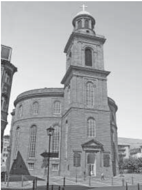
സെന്റ് പോൾസ് ചർച്ച്, ഫ്രാങ്ക്ഫർട്ട്

ഇതിനെ ഒന്നുകൂടി സ്ഥിരപ്പെടുത്തുന്ന തെളിവുകളാണ് ഫെൻസിഷ് ക്നോബ്ബെൻ തുടങ്ങിയ പലതരം ശവകുടലുകളിലെ ഴുതപ്പെട്ടിരുന്ന സാക്ഷ്യങ്ങൾ. വിശ്വാസയോഗ്യമായ ഇത്തരം തെളിവുകളനുസരിച്ച് 1221 മുതൽ ജർമനിയുടെ പ്രധാനപ്പെട്ട എല്ലാ നഗരങ്ങളിലും ഫ്രാൻസിസ്കൻ പാദരക്ഷാർഹിതരുടെ (സഭാസന്യാസികളുടെ) ആശ്രമങ്ങളും ദേവാലയങ്ങളും ഉണ്ടായിരുന്നുവെന്ന് വെളിപ്പെടുത്തുന്നുണ്ട്.