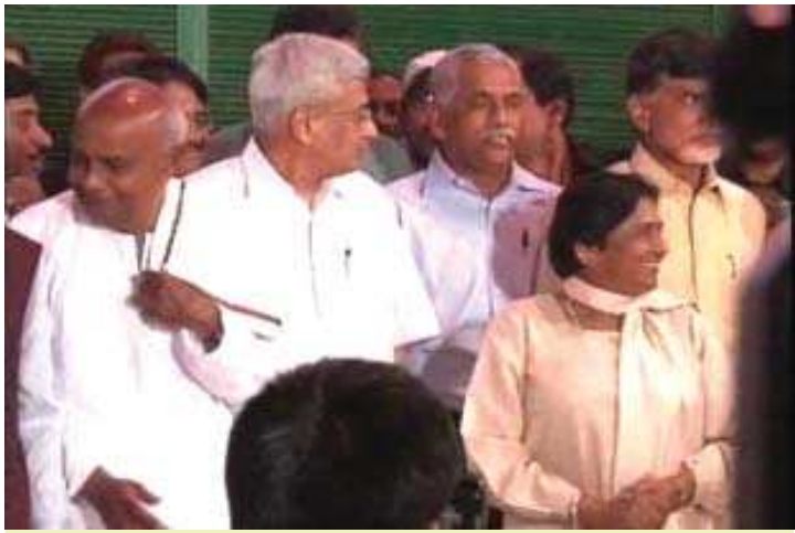
ഇടത്തോട്ടോ വലത്തോട്ടോ: എച്ച്.ഡി.ദേവഗൗഡ, പ്രകാശ് കാരാട്ട്, മായാവതി, ചന്ദ്രബാബു നായിഡു എന്നിവർ.

നമ്മുടെ കേരളത്തിലെ ഇടതുസർക്കാരിന്റെ ആരോപണവും ഇതുതന്നെ. എന്നാൽ ഇതിൽ യാതൊരു കഴമ്പുമില്ലാതെ വസ്തുതകൾ സാക്ഷ്യപ്പെടുത്തുന്നു. ഏകദേശം 56,000 കോടി രൂപയുടെ വികസനപദ്ധതികളാണ് കഴിഞ്ഞ മൂന്നുവർഷം കൊണ്ട് സംസ്ഥാനത്തിന് കേന്ദ്രം അനുവദിച്ചത്. അതിൽ പ്രധാനപ്പെട്ട ഒന്നായ വല്ലാർപാടം കണ്ടെ