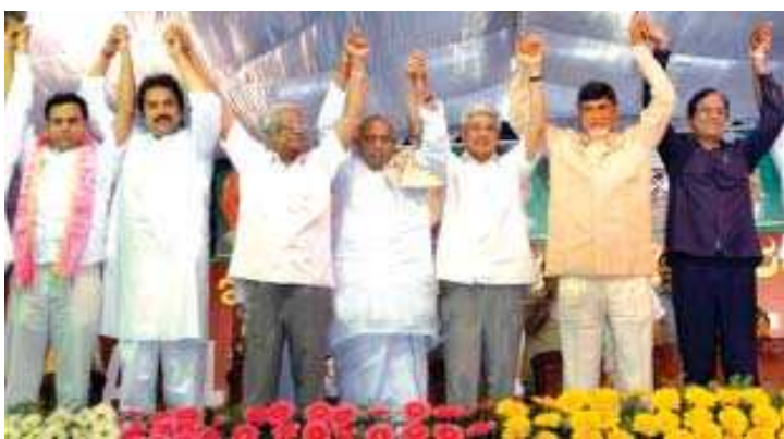
ഉയരാത്ത മോഹം: എൻ.ചന്ദ്രബാബു നായിഡു, പ്രകാശ് കാരാട്ട്, എച്ച്.ഡി. ദേവഗൗഡ, എ.ബി.ബർദൻ തുടങ്ങിയവർ.

ഇന്തോ-അമേരിക്കൻ ആണവകരാറിനെ ഉയർത്തിക്കാട്ടിയാണ് വിദേശനയത്തിൽ വെള്ളം ചേർത്തു എന്ന ആരോപണം കാരാട്ടും കൂടുതൽ ഉന്നയിക്കുന്നത്. നമ്മുടെ രാജ്യത്തിന്റെ ആഭ്യന്തര സുരക്ഷയും നിലനില്പും തന്നെ വൻ ഭീഷണി നേരിട്ട ഇന്തോ-ചൈന യുദ്ധകാലത്ത് മാതൃരാജ്യത്തെക്കാൾ കൂടുതൽ പ്രധാന ന്യൂനതയുടെ ചൈനയ്ക്കുവേണ്ടി വാദിച്ചതിനെത്തുടർന്നു പിളർന്നുപോയ പാർട്ടിയാണ് സിപിഎം. രാജ്യത്തിന്റെ വിദേശ നയത്തെ സംബന്ധിച്ച് അവർക്കുള്ള ഉൽക്കണ്ഠ കാണുമ്പോൾ ചരിത്രത്തെ മാർച്ചുകളോടെ ആർക്കും കഴിയുകയില്ല എന്ന യാഥാർത്ഥ്യം കാരാട്ട് ഉൾപ്പെടെയുള്ളവർ മനസ്സിലാക്കേണ്ടിയിരിക്കുന്നു.