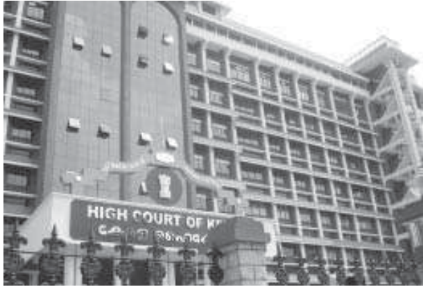
ഭരണഘടനയുടെ അനുച്ഛേദം 227 അനുസരിച്ച്

റിട്ട് എന്ന വാക്കിന്റെ അർത്ഥം കല്പന എന്നാണ്. ഇന്ന് ചെയ്യണം എന്നോ ചെയ്യരുത് എന്നോ കോടതി കല്പിക്കുന്നതിനാണ് റിട്ട് പുറപ്പെടുവിക്കുക എന്നു പറയുക. ഇന്ത്യയിൽ റിട്ട്