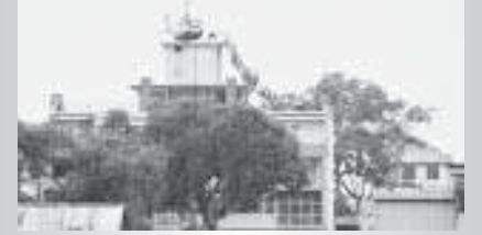
സെയ്ഗോണിലെ എംബസി മന്ദിരത്തിൽ നിന്നും അമേരിക്കക്കാരായ ഉദ്യോഗസ്ഥരെയും പട്ടാളക്കാരെയും അമേരിക്കയുടെ ഹെലികോപ്റ്ററിൽ രക്ഷപ്പെടുത്തിക്കൊണ്ടുപോകുന്നു. (1975 ഏപ്രിൽ 29ന് ഹ്യൂഗ് വാൻ ഏസ് എടുത്ത ചിത്രം)

തെക്കൻ വിയറ്റ്നാമിന്റെ തലസ്ഥാനമായിരുന്ന സെയ്ഗോണിലെ എംബസി മന്ദിരത്തിൽ നിന്നും 1975 ഏപ്രിൽ 29ന് അമേരിക്കക്കാരായ ഉദ്യോഗസ്ഥരെയും പട്ടാളക്കാരെയും, അമേരിക്കയുടെ ഹെലികോപ്റ്ററിൽ ഒഴിപ്പിച്ച രക്ഷപ്പെടുത്തിക്കൊണ്ടുപോകുന്ന ചിത്രമാണ് വിയറ്റ്നാം മണ്ണിലെ അമേരിക്കയുടെ സമ്പൂർണ്ണ പരാജയത്തിന്റെ സാക്ഷ്യപത്രമായി ചരിത്രത്തിൽ ഇടംപിടിച്ചത്.