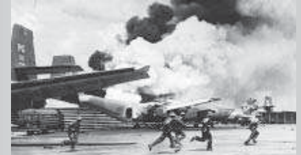
സെയ്ഗോണിലെ വിമാനത്താവളത്തിൽ വടക്കൻ വിയറ്റ്നാം സേന ഖെല്ലാകമണം നടത്തിയപ്പോൾ. (1975 ഏപ്രിൽ 30ന് ഹ്യൂഗ് വാൻ ഏസ് എടുത്ത ചിത്രം)

ഈ ചിത്രത്തിലൂടെയാണ് ഹ്യൂഗ് വാൻ ഏസ് ലോകപ്രശസ്തിയിലേക്ക് ഉയരുകയും അതുവഴി ചരിത്രത്തിന്റെ താളുകളിൽ ഇടം പിടിക്കുകയും ചെയ്തത്. 1941 ജൂലൈ ആറിന് നെതർലണ്ടിലാണ് ഹ്യൂഗ് വാൻ ഏസ് ജനിച്ചത്.