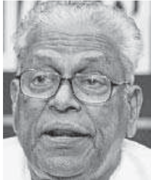
വി. എസ്. അച്യുതാനന്ദൻ

ലാവലീൻ കേസ് വിവാദമായതോടെ കമ്മ്യൂണിസ്റ്റ് കക്ഷികളുടെ കൃത്രിമവസ്ത്രങ്ങൾ വലിച്ചെറിയേണ്ടിവന്നിരിക്കുന്നു. ഇപ്പോൾ കാണുന്ന നേതൃത്വം ലക്ഷ്യബോധമില്ലായ്മയും ബുദ്ധിയില്ലാത്ത രാഷ്ട്രീയ തീരുമാനങ്ങൾക്കൊണ്ടും കൃപ്രസിദ്ധിയാർജിച്ചു കഴിഞ്ഞു. മൂന്നാം മുന്നണിയുടെ പേരിൽ ആസ്രയിൽ ചന്ദ്രബാബു നായിഡു, തെലുങ്കാന സമിതി നേതാവ് ചന്ദ്രശേഖരറാവു എന്നിവരോടൊപ്പം മഹാസഖ്യമുണ്ടാക്കി ഇടതുകക്ഷികൾ മത്സരിച്ചെങ്കിലും വേദങ്ങളുന്നതിന് മുമ്പ് തന്നെ ചന്ദ്രശേഖരറാവു എൻഡിഎ മുന്നണിയുടെ ലുധിയായ നാലിയിൽ പങ്കെടുത്തു. ഓ പ്രകാശ് ചൗട്ടാല നാളുകൾക്ക് മുമ്പ് ഇടതുകക്ഷികളെ മൊഴി ചൊല്ലി.