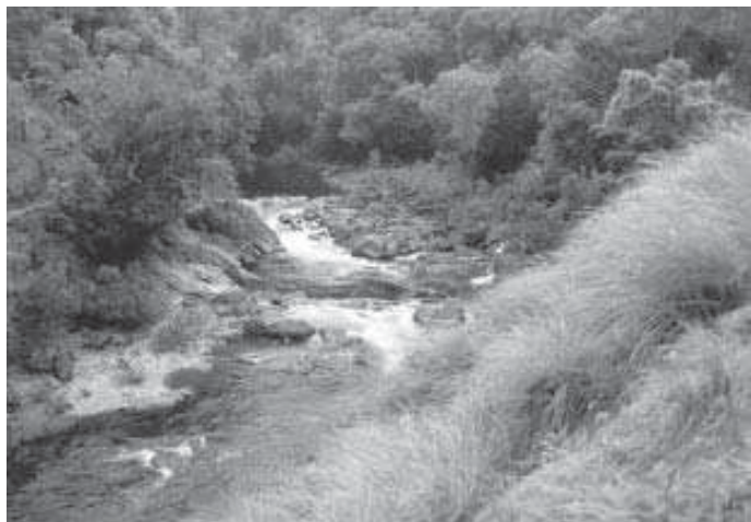
സൈലന്റ് വാലി, പാലക്കാട്

മലിനീകരണം ഇങ്ങനെ തുടർന്നാൽ 2050 ആകുമ്പോഴേക്കും അന്തരീക്ഷതാപം ഇപ്പോഴത്തേതിൽ നിന്ന് 9°F വരെ ഉയരുമത്രെ. ഇങ്ങനെ സംഭവിച്ചാൽ? കാടുകൾ കത്തിനശിക്കും, കൃഷി ഭൂമികൾ മരുഭൂമികളാകും, ധ്രുവങ്ങളിൽ ഹിമാനികൾ ഉരുകും, കടലിലെ ജലനിരപ്പുയർന്ന് താഴ്ന്ന പ്രദേശങ്ങളെല്ലാം മുങ്ങും. ജീവികൾ കൂടിവെള്ളം തേടി അലയും, ജീവിതം ദുസ്സഹമാകും... ഇവിടെയാണ് പരിസ്ഥിതി സംരക്ഷണത്തിന്റെ പ്രസക്തി.