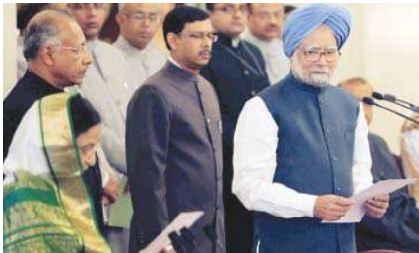
ഇന്ത്യയുടെ 14-മത്തെ പ്രധാനമന്ത്രിയായി ഡോ. മൻമോഹൻ സിംഗ് രാഷ്ട്രപതി പ്രതിഭാ പാട്ടിൽ മുമ്പാകെ സത്യപ്രതിജ്ഞ ചെയ്യുന്നു.

പ്രധാനമന്ത്രി ഡോ. മൻമോഹൻ സിംഗിന്റെ സമർത്ഥവും ആസൂത്രണവൈദഗ്ദ്ധ്യം അകമ്പടി നിന്നതുമായ ഭരണമാണ് ഈ ചരിത്രവിജയത്തിന്റെ പിന്നിലെ മുഖ്യഘടകം. ഒരു സാമ്പത്തിക വിദഗ്ദ്ധനെന്ന നിലയിൽ അദ്ദേഹം അന്താരാഷ്ട്ര പ്രശസ്തനാണ്. റിസർവ് ബാങ്ക് ഗവർണർ, ആസൂത്രണ കമ്മീഷൻ ഉപാധ്യക്ഷൻ, യൂണിവേഴ്സിറ്റി ഗ്രാന്റ്സ് കമ്മീഷൻ ചെയർമാൻ തുടങ്ങിയ നിലകളിലും മുൻ ധനകാര്യമന്ത്രി എന്ന നിലയിലുമുള്ള അദ്ദേഹത്തിന്റെ അനുഭവജ്ഞാനം രാഷ്ട്രത്തിനു മുഴുവൻ മുതൽക്കൂട്ടാവുകയും ലോകരാഷ്ട്രങ്ങൾക്കുമുമ്പിൽ ഇന്ത്യയുടെ പദവി ഉയർത്തുകയും ചെയ്തു.