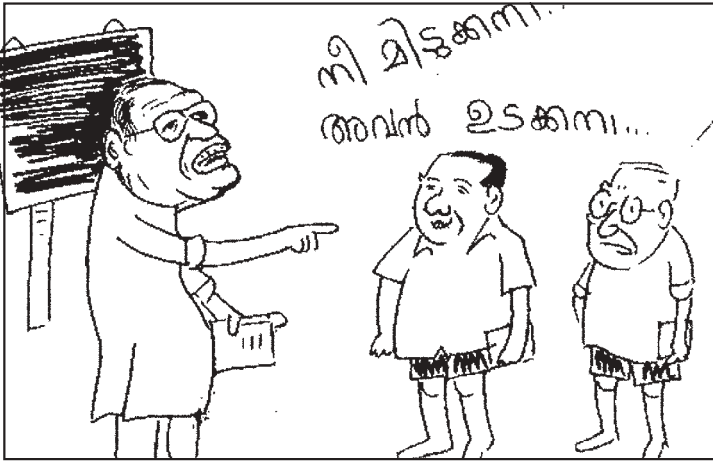
മലയാളത്തിലെ സാഹിത്യവിമർശനത്തെ കുറിച്ച് അഭിമാനിക്കാൻ തക്കവിധത്തിലുള്ള പുസ്തകമെഴുതിയ അഴീക്കോട്, ഗാന്ധിജിയെക്കുറിച്ച് മലയാളത്തിലിറങ്ങിയ ഏറ്റവും നല്ല പുസ്തകങ്ങളിലൊന്ന് 'മാഹാത്മാവിന്റെ മാർഗ്ഗം' എന്ന പുസ്തകമാണ്. ഈ ഗ്രന്ഥകർത്താവ് എപ്പോഴും അവകാശപ്പെടുന്നത്

തിരുവിതാംകൂറിൽ 1920ൽ രാജഭരണത്തിനെതിരെ നിലകൊണ്ട സഭദേശാഭിമാനി രാമ