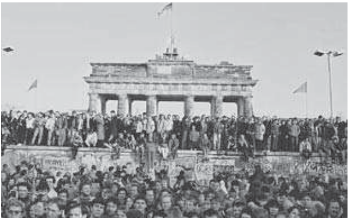
1989 നവംബർ 9ന് ബെർലിനിലെ ബ്രാൻഡൻ ബെർഗർ ടോറിൽ തടിച്ചുകൂടിയ ജർമൻ ജനത.

1948 ജൂലൈ ഒന്നാം തീയതിഫ്രാങ്ക് ഫർട്ടിലെ അമേരിക്കൻ ആർമി ഹെഡ്ക്വാർ ടേഴ്സിൽ മുന്നൂപേർ ആഗതരായി. അമേരിക്കക്കാരൻ ലൂസിയിസ് ഡെ. ക്ലേ. ഇംഗ്ലീഷ്കാ രൻ ബ്രയൺ ജോൺസൺ, ഫ്രഞ്ചുകാരൻ പിയേർ ക്യോനീസ്. ഇവർ മൂവരും പശ്ചിമ ജർമനിയിലേക്കു നിയോഗിക്കപ്പെട്ട സഖ്യകക്ഷികളുടെ പശ്ചിമ ജർമൻ മേഖലാ ഗവർണ്ണർമാരാണ്. യുദ്ധാനന്തര ജർമനിയുടെ ഭാ വി ഇവരുടെ കരങ്ങളിലാണിരിക്കുന്നത്. ഇവർക്കൊപ്പം കുറെ ജർമൻകാരും എത്തിച്ചേർ നിരുന്നു. ജർമനിയിലെ സംസ്ഥാന മുഖ്യമന്ത്രിമാരാണ്. രാജ്യത്തിന്റെ രാഷ്ട്രീയ ഗതി വിഗതികൾ ബോധ്യപ്പെട്ടവർ.