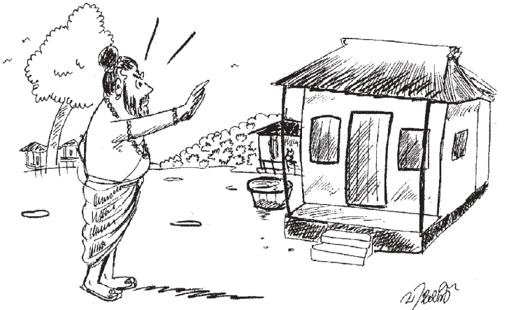
ഓടപ്പം ദേഷ്യവും അകമ്പടിയായിവന്നു. മുഖത്തേക്കു തുറിച്ചു നോക്കി. ഒന്നും മിണ്ടാതെ സന്യാസി സ്ത്രീയുടെ

എത്തി. വാതിൽ അടഞ്ഞു കിടക്കുകയായിരുന്നു. “ഭിക്ഷാംദേഹി,” സന്യാസി ഉറക്കെ പറഞ്ഞു. വാതിൽ തുറന്നില്ല. അകത്തുനിന്ന് ഒരു മറുപടിയും ഉണ്ടായില്ല. സന്യാസികൾ ദേഷ്യം വന്നു. തന്റെ തപശക്തികൊണ്ട് വീടുതന്നെ ചുട്ടുചാമ്പലാക്കണമെന്ന് സന്യാസികൾ തോന്നി. അല്പം കൂടി ഉറക്കെ അദ്ദേഹം പറഞ്ഞു. ഭിക്ഷാംദേഹി. അല്പം സമാധാനത്തോടെ നില്ക്കൂ. ഞാനാപക്ഷിയല്ല. വീടിനുള്ളിൽ നിന്നും ഒരു സ്ത്രീശബ്ദം. സന്യാസികൾ കോപം ആളിക്കത്തി. കണ്ണടച്ച് മന്ത്രം ജപിച്ചു. പിന്നെ കണ്ണുതുറന്ന് വാതിലിലേക്ക് തുറിച്ചു നോക്കി. അത്ഭുതം, ഒന്നും സംഭവിച്ചില്ല. അല്പം കഴിഞ്ഞ് ഒരു സ്ത്രീ വാതിൽ തുറന്ന് പുറത്തുവന്നു. “ഞാൻ അവശനായി കിടക്കുന്ന എന്റെ ഭർത്താവിനെ ശുശ്രൂഷിക്കുകയായിരുന്നു. അതാണ് എന്റെ ഇപ്പോഴത്തെ ധർമ്മം. ഞാൻ എന്റെ ധർമ്മം ചെയ്തു. നിങ്ങൾക്ക് ഭിക്ഷ തരുകയില്ല. ഇവിടെ ഇപ്പോൾ ഒന്നും ഇല്ല. നിങ്ങൾക്ക് പോകാം. ആ സ്ത്രീശബ്ദത്തോ