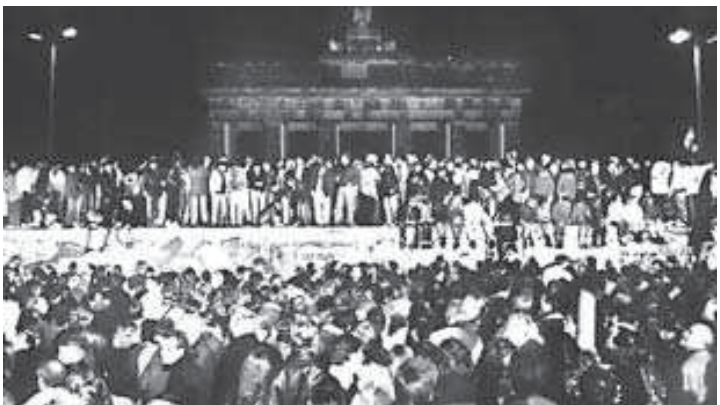
ബെർലിൻ മതിലിന്റെ പതനത്തിൽ ആഹ്ലാദം പ്രകടിപ്പിക്കുന്ന ജർമൻ ജനത.

കണ്ണടച്ചു തുറന്ന സമയത്തിനുള്ളിൽ കടകളിൽ എന്തും ലഭ്യമായിത്തുടങ്ങി. ഒരു സ്വപ്നം പോലെ, ജർമനിയുടെ കഷ്ടകാലം അതോടെ മാറി. സമൃദ്ധിയിലേക്കുള്ള വാതിൽ മലർക്കെ തുറക്കപ്പെട്ടു. ഇങ്ങനെ