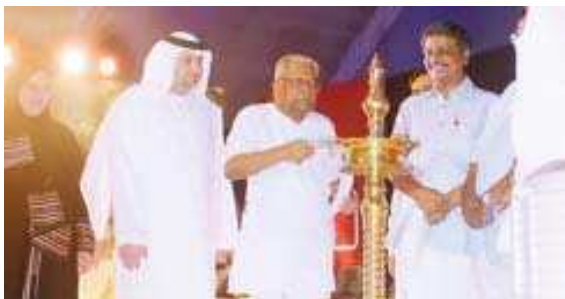
തുടക്കം പിഴച്ചോ?: മുഖ്യമന്ത്രി വി.എസ്.അച്യുതാനന്ദൻ സ്മാർട്സിറ്റി പ്രവർത്തനം ഉദ്ഘാടനം ചെയ്യുന്നു.

ഇൻഫോ പാർക്കും 62.57 ഏക്കർ സ്ഥലവും 109 കോടി രൂപയ്ക്കു ടീകോമിനു വിട്ടുകൊടുക്കാമെന്ന യു.ഡി.എഫ്. ഗവൺമെന്റു കാലത്തെ വ്യവസ്ഥ ഇപ്പോൾ ഒഴിവാക്കി. ഇതുമൂലം പദ്ധതി നടത്തിപ്പു മൂന്നു വർഷമെങ്കിലും വൈകുമെന്നു പ്രതിപക്ഷ നേതാവ് ഉമ്മൻചാണ്ടി മുന്നറിയിപ്പു നൽകിയിരുന്നു. ഇൻഫോപാർക്ക് വിട്ടുകൊടുത്തിരുന്നെങ്കിൽ ആറുമാസത്തിനകം സ്മാർട്സിറ്റി യാഥാർത്ഥ്യമാകുമായിരുന്നെന്നും അദ്ദേഹം ചൂണ്ടിക്കാണിച്ചിരുന്നു. പ്രതിപക്ഷനേതാവ് ഇൻഫോ ഇപ്പോൾ യാഥാർത്ഥ്യമായിരിക്കുകയാണ്.