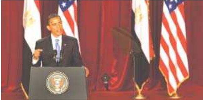
ഇറാഖിൽ സന്ദർശനത്തിനിടെ കെയ്റോ യൂണിവേഴ്സിറ്റിയിൽ പ്രഭാഷണം നടത്തുന്ന അമേരിക്കൻ പ്രസിഡണ്ട് ബറാക് ഒബാമ.

ഒരേസമയം 13 ഭാഷകളിലേക്കു മൊഴിമാറ്റം ചെയ്തുകൊണ്ടിരുന്ന ഒബാമയുടെ പ്രസംഗം ലോകമെമ്പാടുമുള്ള ടെലിവിഷൻ പ്രേക്ഷകർ ഏറെ താല്പര്യത്തോടെ കണ്ടുകൊണ്ടിരുന്നു. ഇതിനു മുമ്പ് ഒരമേരിക്കൻ പ്രസിഡണ്ടിൽ നിന്നും ഇത്രയും വ്യക്തവും സൗഹൃദപൂർണ്ണവുമായ വാക്കുകൾ മധ്യപൂർവ്വദേശത്തെങ്ങും എത്തിയിട്ടില്ലാതെ.