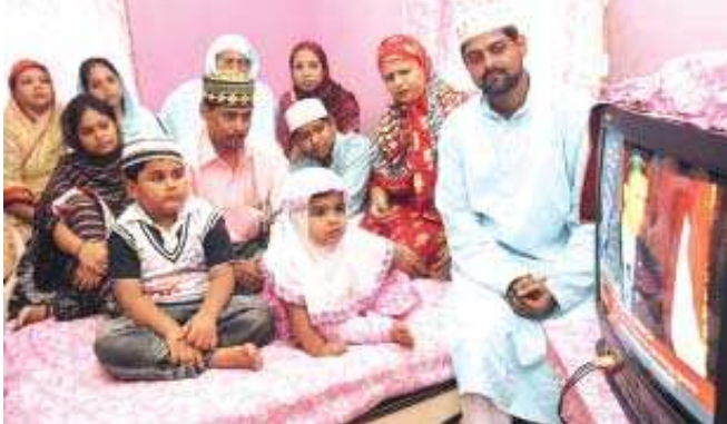
ഒബാമയുടെ കെയ്റോ പ്രഭാഷണം ടിവിയിൽ ശശരഥം വീക്ഷിക്കുന്ന ഒരു മുസ്ലീം കുടുംബം. (കൊൽക്കത്തയിൽ നിന്നുമുള്ള ദൃശ്യം).

ഫലമണിയുമെന്ന് അവർ പ്രതീക്ഷിക്കുന്നു. ലോകസമാധാനത്തിന്റെ കാവൽദൂതനെപ്പോലെയാണ്, ഇസ്ലാം സംസ്കാരത്തിന്റെ ജിനുകൾ ഉള്ളിൽ വഹിക്കുന്ന ബറാക് ഹുഗെസൻ ഒബാമ മധ്യപൂർവ്വദേശരാഷ്ട്രങ്ങളിലെത്തിയത് എന്നതു ലോകത്തിനുതന്നെ പുതിയ പ്രതീക്ഷ നല്കുന്നു. #