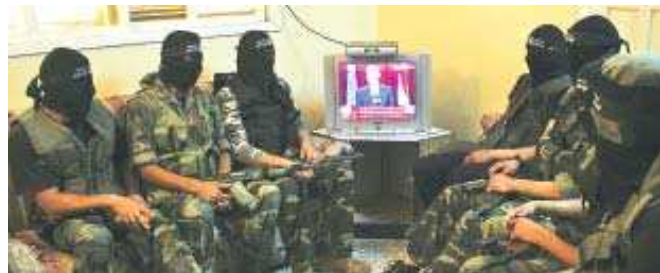
ബറാക് ഒബാമയുടെ കെയ്റോ യൂണിവേഴ്സിറ്റി പ്രഭാഷണം ടിവിയിൽ തത്സമയം കാണുന്ന ഹമാസ് പോരാളികൾ (ശാസയിൽ നിന്നുമുള്ള ദൃശ്യം).

മുസ്ലീം രാജ്യങ്ങൾ തമ്മിൽ സമാധാനവും സുസ്ഥിരതയും കൈവരുത്തുന്ന പങ്കാളിത്തമുണ്ടാകണമെന്ന അദ്ദേഹത്തിന്റെ ആഹ്വാനം തികച്ചും സ്വാഗതാർഹമാണ്.