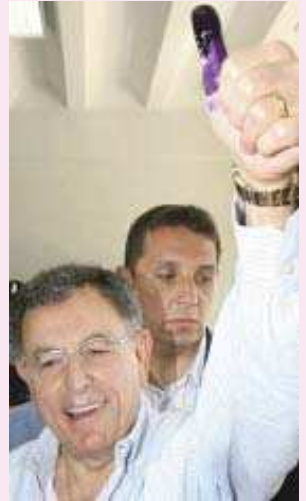
സീറോയിലെ ബൂത്തിൽ വോട്ടുരേഖപ്പെടുത്തിയശേഷം പ്രധാനമന്ത്രി ഹാൾ സിനിയോ.

ഇസ്ലാംമതസ്ഥരാണ് ഭൂരിപക്ഷവും. പക്ഷേ, അവർ ഷിയാ, സുന്നി, ഡ്രൂസ് എന്നീ പ്രധാനവിഭാഗങ്ങളായി വേർപിരിഞ്ഞുതന്നെ നില്ക്കുന്നു. ഇതുപോലെ തന്നെയാണ് മുപ്പത് ശതമാനത്തോളം വരുന്ന ക്രൈസ്തവർ. കത്തോലിക്കാസഭയുടെ ഭാഗമായിനിന്ന് പോപ്പിനെ അംഗീകരിക്കുന്ന മാർനെറ്റ്