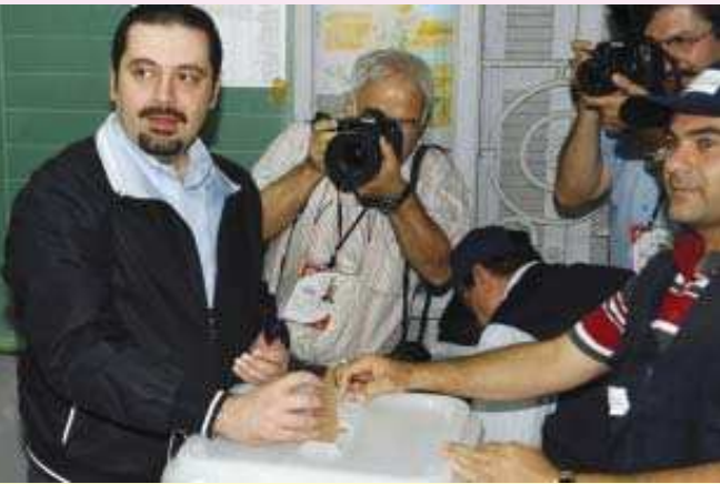
സാർ ഹരീരി വോട്ടു രേഖപ്പെടുത്തുന്നു.