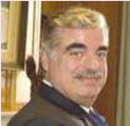
മുൻ പ്രധാനമന്ത്രി റഫീക്ക് ഹരീരി

സുന്നി, ഡ്രൂസ് എന്നീ മുസ്ലിംവിഭാഗങ്ങൾകൂടി ഭാഗമായുള്ള മുന്നണിയാണ് വൻവിജയം നേടിയിരിക്കുന്നത്. ഷിയാ വിഭാഗത്തിന്റെ പിന്തുണയോടെ മത്സരിച്ച ഹിസ്ബല്ല പരാജയം ആവർത്തിച്ചു. തങ്ങൾ ജനവിധിയെ അംഗീകരിക്കുന്നതായി ഹിസ്ബല്ല നേതാവ് ഹസ്സൻ നസ്റല്ലയും പറഞ്ഞു.