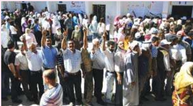
ലെബനനിലെ സാഹ്ലെയിലുള്ള ബൂത്തിൽ വോട്ടുചെയ്യാൻ ക്യാമ്പിലിരിക്കുന്നവർ.

2005ൽ ഒരു കാർ ബോംബ് സ്ഫോടനത്തിൽ കൊല്ലപ്പെട്ട മുൻ പ്രധാനമന്ത്രി റഫീക്ക് ഹരീരിയുടെ മകൻ സാർ ഹരീരി നയിച്ച മുന്നണി തന്നെയായിരുന്നു കഴിഞ്ഞ തവണയും വിജയിച്ചത്. തുടർന്ന് ഹാൾ സിനിയോ പ്രധാനമന്ത്രിയായി ചുമതലയേറ്റിരുന്നു.