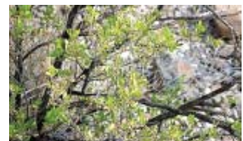
റ്റാർബുഷ് (തെക്കേ അമേരിക്കയിലെ ചിഹ്വാഹെൻ മരുഭൂമിയിൽ കൂടുതലായി കാണപ്പെടുന്ന സസ്യം).