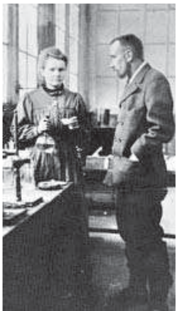
മേരി ക്യൂറിയും ഭർത്താവ് പിതർ ക്യൂറിയും ലബോറട്ടറിയിൽ പരീക്ഷണവേളയിൽ

മേരിയുടെ ജീവിതത്തിലെ വഴിത്തിരിവുതന്നെയായിരുന്നു പിതർ ക്യൂറിയുമായുള്ള സൗഹൃദവും തുടർന്നുള്ള വിവാഹവും. രണ്ടുപേർക്കും താത്പര്യം ഒരേമേഖലയോട്, ആഗ്രഹവും അതേപോലെ.