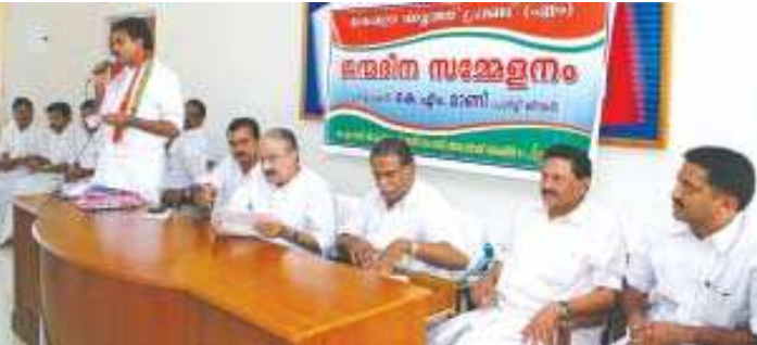
കേരള യൂത്ത് ഫ്രണ്ട് (എം) ജന്മദിനസമ്മേളനത്തോടനുബന്ധിച്ച് നൽകിയ സ്വീകരണത്തിൽ ജോസ് കെ.മാണി എം.പി. പ്രസംഗിക്കുന്നു.

തോമസ് ഐസകിന്റെ പ്രസ്താവന സംസ്ഥാനസർക്കാരിനെതിരായ കുറ്റപത്രമാണ്. ഇടതുപാളയത്തിൽനിന്നുതന്നെ ഉണ്ടായിരിക്കാണ്ടിരിക്കുന്നതായ ഇത്തരം പ്രസ്താവനകൾ ഈ സർക്കാരിനെതിരായ ജനരോഷത്തെ സാധൂകരിക്കുന്നു.