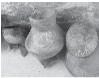
കേരള പുരാവസ്തുവകുപ്പിന്റെ ചെറുതൊഴിൽ കണ്ടെത്തിയ നൂറ്റാണ്ടുകൾ പഴക്കമുള്ള കൂടങ്ങൾ

കേരളത്തിലെ പ്രാകൃതചരിത്രത്തിന്റെ മറ്റൊരു വിശേഷത, ശിലായുഗത്തിൽ നിന്ന് അയോധുഗത്തിലേക്ക് നേരിട്ടൊരു ചാട്ടമാണു് ഇവിടെത്തെ പ്രമാണങ്ങളിൽ കാണുന്നതെന്നതാണു്. ഒരു കാൽക്കോലിത്തിക്ക് യുഗമോ താമ്രയുഗമോ ഇവിടെ ഇടയ്ക്കു നിലക്കുന്നില്ല. ഈയൊരു "ഡബിൾ പ്രമോ