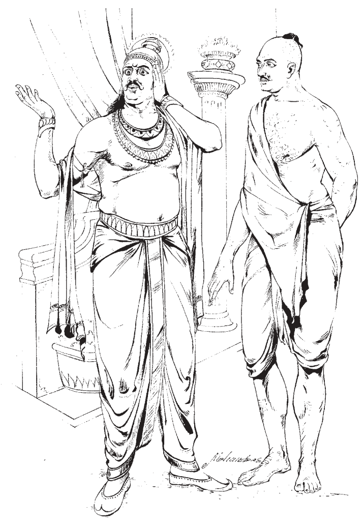
നേരുകയിലൊരടി കിട്ടിയാലെന്നതുപോലെ ദ്രുപദൻ കുറച്ചുനേരം സ്മരണിച്ചു നിന്നുപോയി. പിന്നെ ചോദിച്ചു: “എന്താണു പറഞ്ഞത്? എന്റെ മകളെ നിങ്ങൾ അഞ്ചുപേരും വിവാഹം ചെയ്യുമെന്നോ?”

എത്ര ആലോചിച്ചിട്ടും ദ്രുപദൻ യുധിഷ്ഠിരന്മാർക്കുൾ സ്വീകാര്യമായില്ല. മകളെ അഞ്ചുപേർക്ക് ഭാര്യയായി കൊടുക്കുക. ഘോരം, ആളുകളെത്തു പറയും? അഞ്ചുവീരന്മാരെ കണ്ടപ്പോൾ മനസ്സിലകിപ്പോയെന്നു പറയില്ലേ? അവരുടെ സഹായം സന്തം രാജ്യസുരക്ഷയ്ക്കുറപ്പിക്കാൻ മകളെ വില്പയായി കൊടുത്തു എന്നാക്ഷേപിക്കില്ലേ? മറ്റുള്ളവ