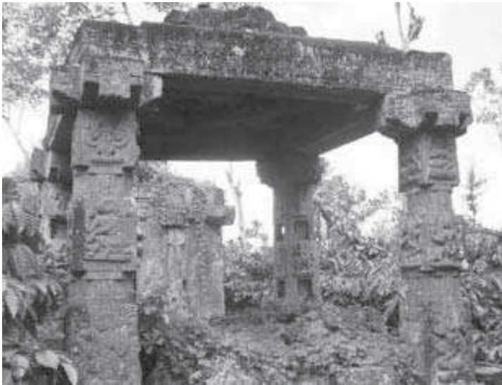
ഒരു പഴയ കൽമണ്ഡപം

ഒന്നാമതായി, രാജാവ് നേട്ടി ഭൂമി ദാനം ചെയ്ത ബ്രഹ്മദേവങ്ങളുണ്ടാക്കുന്ന രേഖകൾ ഇവിടെ ഇല്ലെന്നതു തന്നെ. ഉണ്ട്, പഴയൊരു രേഖ പകർത്തിയതാണെന്നവകാശപ്പെടുന്ന