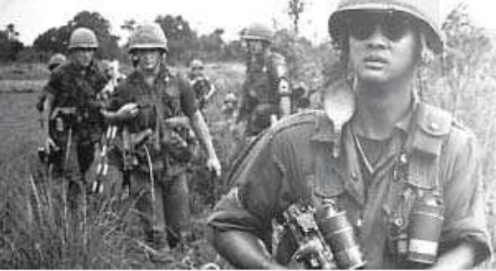
വിയറ്റ്നാം യുദ്ധമുമ്പിലെ അമേരിക്കൻ പട്ടാളക്കാർ

1967ൽ വടക്കൻ വിയറ്റ്നാമിലെ തെക്കൻ പ്രവിശ്യയിൽ അമേരിക്കൻ അധിനിവേശത്തിനെതിരെ നടന്ന പ്രകടനത്തെ ലക്ഷ്യമാക്കി ബോംബാക്രമണം നടത്തിയതിൽ ലോകമെമ്പാടും വൻ പ്രതിഷേധമുണ്ടായി. ഇതിനെത്തുടർന്ന് റോബർട്ട് മക്നമാരയെ പ്രതിരോധസെക്രട്ടറി സ്ഥാനത്തുനിന്നും നീക്കുവാൻ അന്നത്തെ പ്രസിഡണ്ടായിരുന്ന ലിൻഡൻ ബി.ജോൺസൺ നിർബന്ധിതനായി. പ്രതിരോധ സെക്രട്ടറി പദവിയിൽനിന്നും പടിയിറങ്ങിയ മക്നമാരയെ ലോകബാങ്കിന്റെ പ്രസിഡണ്ടു പദമാണ് കാത്തിരുന്നത്. 1981 മുതൽ അദ്ദേഹം ഔദ്യോഗിക ജീവിതത്തിൽ നിന്നും വിരമിച്ച് വിശ്രമജീവിതം നയിക്കുകയായിരുന്നു.