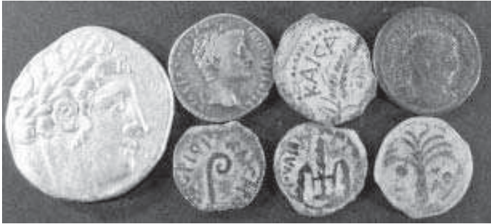
കേരളത്തിൽ നിന്നും കണ്ടെത്തിയ റോമൻ നാണയങ്ങൾ