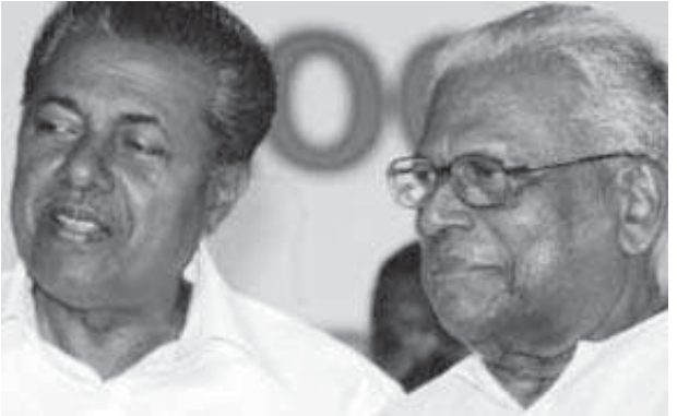
വാശനാശം സംഭവിച്ച ഐക്യം: പിന്നറായി വിജയനും പി.എസ്.അച്യുതാനന്ദനും (ഒരു ഫയൽ ചിത്രം)

വിജയൻ കേരളത്തിലെ പാർട്ടി സെക്രട്ടറിയായി. അതുകൊണ്ട് തന്നെ പാർട്ടി സെക്രട്ടറിയുടെ തിളക്കമാണ് പാർട്ടിയുടെയും തിളക്കം. ക്ലാസ്സു പിടിച്ചു തിളക്കം മങ്ങിയ സെക്രട്ടറിയായിത്തീർന്നിരിക്കുന്നു, ലാവിലിൻ ആരോപണത്തോടെ വിജയൻ. അത് തേച്ചു മിനുക്കി ക്ലാവ് കളയുന്ന സ്ഥലമാണ് കോടതി. അവിടെവരെ പോകാൻ വിജയനെ പാർട്ടി ഉപദേശിക്കണമായിരുന്നു. എന്തുകൊണ്ട് അതിന് കഴിഞ്ഞില്ല എന്ന് ജനങ്ങളോട് വ്യക്തമാക്കാത്തതിനോടൊപ്പം കാലം പി.ബിയും സംശയത്തിന്റെ നിഴലിലാണ്.