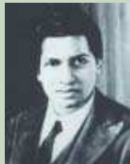
ശ്രീനിവാസ രാമാനുജൻ (1887 - 1920) 15

മുഖപ്രസംഗം 2 വിദ്യാഭ്യാസ മികവു തകർക്കാനോ പുറപ്പാട്?