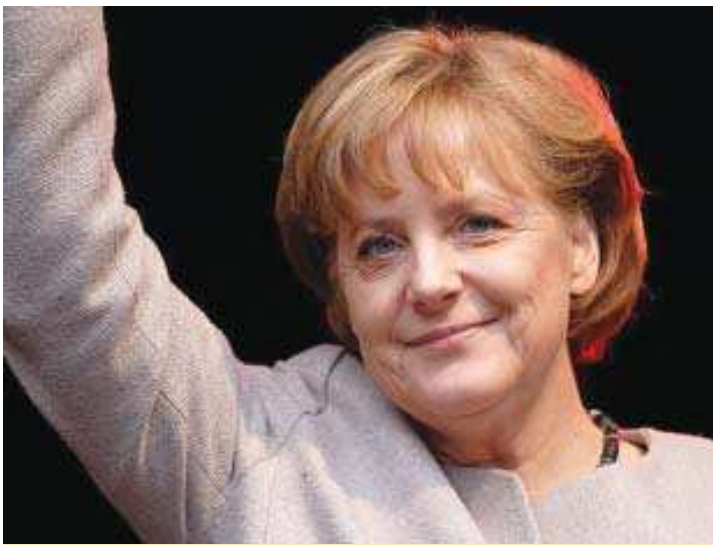
നിലവിലെ ചാൻസലറും സിഡിയു-ഡിഎസ്യു സഖ്യത്തിന്റെ ചാൻസലർ സ്ഥാനാർത്ഥിയുമായ അൻഗെലാ മെർക്കൽ.

രാഷ്ട്രീയ കാലാവസ്ഥ എങ്ങനെ മാറിമറിഞ്ഞാലും ജർമനിയിൽ ഒരു കൂട്ടുകക്ഷി സർക്കാരിനേ പ്രസക്തിയുള്ളൂ. വലിയ രാഷ്ട്രീയ പാർട്ടികളുടെ മേൽ ജനങ്ങൾക്കുള്ള വിശ്വാസം കുറഞ്ഞുവരുന്നു. സിഡിയു-സിഎസ്യുവിന് പതിമൂന്നു ശതമാനവും എസ്ഡിപിക്കു എട്ടു ശതമാനവും ജനങ്ങളുടെ പിന്തുണയാണ് ഏറ്റവും ഒടുവിൽ വന്ന സർവ്വേഫലം നൽകുന്നത്. ആകെയുള്ള ജനങ്ങളിൽ 59 ശതമാനം പേരും എസ്ഡിപിയുടെ പ്രവർത്തനങ്ങളിൽ അത്യപ്തരാണ്. അതേസമയം സിഡിയുവിന്റെ ജനപ്രീതി വർദ്ധിച്ചിരിക്കുന്നുവെന്നും സർവ്വേഫലങ്ങൾ വ്യക്തമാക്കുന്നു.