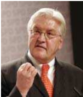
സോഷ്യൽ ഡെമോക്രാറ്റിക് പാർട്ടിയുടെ ചാൻസലർ സ്ഥാനാർത്ഥി ഫ്രാങ്ക് വാൾട്ടർ സ്റ്റയിൻമയർ

തിരഞ്ഞെടുപ്പ് അടുത്തതോടെ ജർമനിയുടെ രാഷ്ട്രീയ അന്തരീക്ഷം കൂടുതൽ സജീവമായിരിക്കുന്നു. നിലവിലുള്ള മഹാകൂട്ടുകക്ഷി ഗവൺമെണ്ട് അധികാരം നിലനിർത്തുന്നതിനായി കഠിനാധ്വാനം ചെയ്യുന്നുണ്ട്. ജർമനിയുടെ പ്രമുഖ രാഷ്ട്രീയ പാർട്ടികളായ ക്രിസ്ത്യൻ ഡെമോക്രാറ്റിക് യൂണിയൻ (സിഡിയു), ക്രിസ്ത്യൻ സോഷ്യൽ യൂണിയൻ (സിഎസ്യു), സോഷ്യൽ ഡെമോക്രാറ്റിക് പാർട്ടി (എസ്ഡിപി) എന്നിവയും മഹാകൂട്ടുകക്ഷി ഗവൺമെന്റിന്റെ ഭാഗമാണ്.