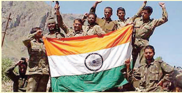
1999 ജൂലൈ 26നു കാർഗിലിൽ യുദ്ധവിജയം നേടിയ ഇന്ത്യൻ സൈനികരുടെ ആഘോടനം.

കഴിഞ്ഞ മൂന്നു മാസത്തിലേറെയായി സംഘർഷാവസ്ഥ തുടരുന്ന കാശ്മീരിൽ വിഘടന പ്രവർത്തനത്തിൽ ഏർപ്പെട്ടിരിക്കുന്നവർക്കു പുറമെ പിന്തുണ പ്രഖ്യാപിച്ചു പാകിസ്ഥാൻ പാർലമെന്റു പ്രമേയം പാസ്സാക്കിയതു ലോകചരിത്രത്തിൽ തന്നെ സമാനതകളില്ലാത്ത നിന്ദ്യ പ്രവൃത്തിയാണ്. സാമ്രാജ്യത്വവാദത്തിനു വിരാമം കുറിച്ചു ലോകരാഷ്ട്രങ്ങളെല്ലാം തന്നെ പരസ്പര സഹകരണത്തിലേക്കും ജനാധിപത്യ ഭരണക്രമത്തിലേക്കും പദ്ധ്യമുന്നുന്ന ഈ കാലഘട്ടത്തിൽ, തങ്ങളുടെ രാജ്യം അതിനൊരപവാദമാണെന്നു തുടരേത്തുടരെയുള്ള നടപടികളിലൂടെ പാകിസ്ഥാൻ ഭരണകൂടവും രാഷ്ട്രീയ നേതൃത്വവും തെളിയിച്ചു കൊണ്ടിരിക്കുന്നു. ആഭ്യന്തര സംഘർഷത്തിന്റെയും വിഘടനവാദത്തിന്റെയും തീക്തഫലം ഇന്ന് ഏറ്റവും കൂടുതൽ അനുഭവിച്ചുകൊണ്ടിരിക്കുന്ന ഒരു രാഷ്ട്രം പാകിസ്ഥാൻ പോലെ മറ്റൊന്നില്ല. തങ്ങളുടെ രാജ്യത്തെ ജനങ്ങളുടെ സുരക്ഷപോലും ഉറപ്പാക്കാൻ കഴിയുന്നില്ല എന്നു പാക് പ്രധാനമന്ത്രിതന്നെ പരസ്യമായി പറഞ്ഞിട്ടുണ്ട്. അങ്ങനെയുള്ള ഒരു ഭരണകൂടത്തിൽ നിന്നാണു തൊട്ട് അയൽപക്കമായ ഒരു രാജ്യത്തെ ആഭ്യന്തരപ്രശ്നത്തിനു പ്രോത്സാഹനം നൽകുന്ന സമീപനം ഉണ്ടായതെന്നതു തികച്ചും ദുർഭാഗ്യകരവും ഞെട്ടിക്കുന്നതുമാണ്.