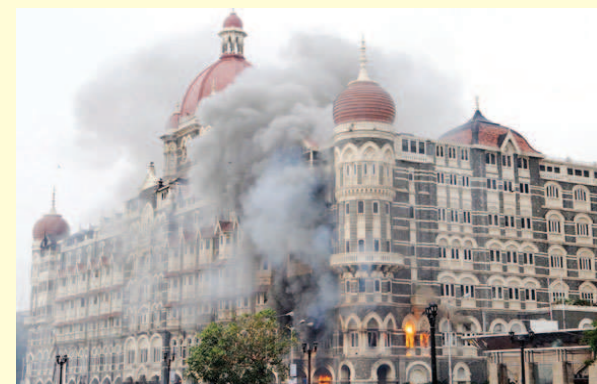
മുംബൈ ഭീകരാക്രമണത്തിനു വേദിയായ താജ് ഹോട്ടൽ.

നിഷ്ഠൂരമായ മുംബൈ ഭീകരാക്രമണവും ലോകം മറന്നിട്ടില്ല അതിൽ പിടിയിലായ ഏക കുറ്റവാളി അജ്മൽ ആമിർ കസബിന്റെ മൊഴിയും, തുടർന്നു നടന്ന അന്വേഷണങ്ങളും പാകിസ്ഥാനെയും ഐ.എസ്.ഐയെയും പ്രതിക്കൂട്ടിലാ