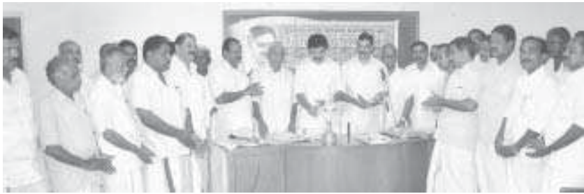
കേരളാ നെൽകർഷക യൂണിയൻ (എം) സംസ്ഥാന നേതൃസംഗമം ജോസ് കെ. മാണി എം.പി. ഉദ്ഘാടനം ചെയ്യുന്നു.

രാസവളങ്ങളുടെ വില നിയന്ത്രിക്കാനുള്ള അധികാരം കേന്ദ്ര ഗവൺമെണ്ട് പുനഃസ്ഥാപിക്കുകയും വളം ലഭ്യത ഉറപ്പുവരുത്തുകയും വേണമെന്നു കേരളാ കോൺഗ്രസ് (എം) സംസ്ഥാന ജനറൽ സെക്രട്ടറി ജോസ് കെ.മാണി എം.പി ആവശ്യപ്പെട്ടു. കഴിഞ്ഞ സിസണിൽ ഒരു ചാക്ക് ഫാക്ടം ഫോസിഫ് (50 കിലോ) 380 രൂപയും പൊട്ടാഷിന് 292 രൂപയും ആയിരുന്നത് ഏതാണ്ട് ഇരട്ടിയായി. കേരളത്തിലെ നെൽ കർഷകൻ അടുത്ത കൃഷി ഇറക്കുന്നതിനു തയ്യാറെടുക്കുമ്പോൾ വളത്തിന്റെ വിലയിലുണ്ടായ വർധനവ് അവർക്കു കടുത്ത സാമ്പത്തിക പ്രതിസന്ധി സൃഷ്ടിക്കുമെന്നും അദ്ദേഹം പറഞ്ഞു.