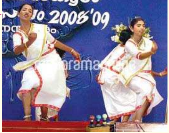
സ്കൂൾ കലോത്സവവേദിയിൽ മാർഗ്ഗംകളി

ഞെട്ടും വാലും ഇട്ടു മുണ്ടടുത്തു കത്രിക പൂട്ടിട്ടു നേരിയതു തലയിൽ കെട്ടി ചുവന്ന അരക്കെട്ടുമായി 'അരയും തലയും മുറുക്കി' പുരുഷന്മാർ കളിക്കുന്നു. മാർഗ്ഗംകളി താണു