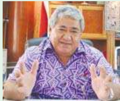
തുലെയ്പ സെയ്ലിലി മലീലിഗോ (പ്രധാനമന്ത്രി)

അന്താരാഷ്ട്ര സമയരേഖയ്ക്കു കിഴക്കും ഭൂമധ്യരേഖയ്ക്കു തെക്കുമായി കിടക്കുന്ന സമോവയിൽ രണ്ടു വലിയ ദ്വീപുകളും എട്ടു ചെറു ദ്വീപുകളുമുണ്ട്. ഉപോലു, സവായി എന്നിവയാണു വലിയ ദ്വീപുകൾ. മനോനോ, അപോലിമ, നൂത്തിലി, നൂലുവ, ഫാനു, വതാപ്പു, നൂസാഫി,സുലോപ്പ എന്നിവ ചെറുദ്വീപുകളും. അഗ്നിപർവത ദ്വീപുകളാണ് ഇവയെല്ലാം. സമോവ ജനതയുടെ മൂന്നിലൊന്നും ഉപോലുവിൽ വസിക്കുന്നു. തലസ്ഥാനമായ അപ്പിയയും ഈ ദ്വീപിലാണ്.