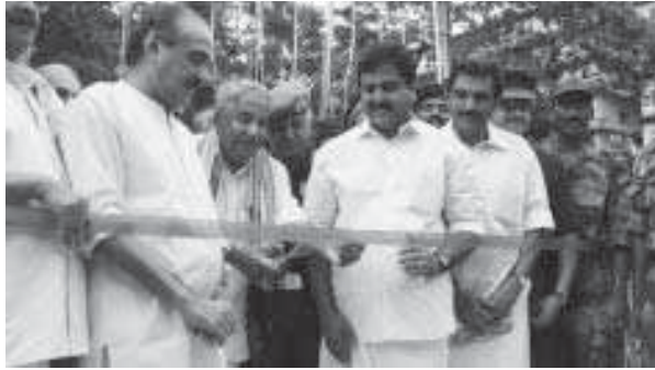
ശരണസേതുവിന്റെ ഉദ്ഘാടനം ശബരിമല സന്നിധാനത്തു മുഖ്യമന്ത്രി ഉമ്മൻ ചാണ്ടി നിർവഹിക്കുന്നു. ധനമന്ത്രി കെ.എം.മാണി, ദേവസ്വം മന്ത്രി വി.എസ്. ശിവകുമാർ തുടങ്ങിയവർ സമീപം.

ശബരിമല സന്നിധാനത്തു മണ്ഡലകാലത്തു വർധിച്ചുവന്നുകൊണ്ടിരിക്കുന്ന തിരക്കിനു ശമനം ഉണ്ടാക്കുവാൻ പുതുതായി നിർമ്മിച്ച ശരണസേതുവിനു കഴിയും. മൂന്നുമാസം കൊണ്ടു കരസേനയുടെ ബാംഗ്ലൂർ ആസ്ഥാനമായ മദ്രാസ് എഞ്ചിനീയറിംഗ് ഗ്രൂപ്പാണ് പാലവും അനുബന്ധ റോഡും നിർമ്മിച്ചത്.