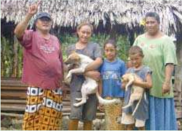
ഒരു സമോവൻ കുടുംബം.