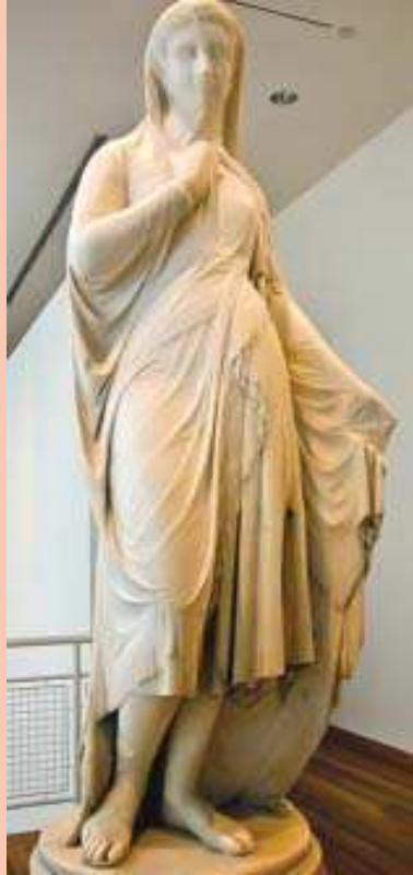
'മുടുപടമണിഞ്ഞ റെബേക്ക' എന്ന വെണ്ണക്കൽ ശില്പം

വിവിധ വലുപ്പത്തിലുള്ള വിപുലമായ ഒരു ഖുറാൻശേഖരം ഇവിടെയുണ്ട്. മ്യൂസിയത്തിൽ പ്രദർശിപ്പിച്ചിട്ടുള്ള ക്ലോക്കുകളുടെ നിര അമ്പരപ്പിക്കുന്നതാണ്. പുരാതന പൂഴി ഘടികാരം മുതൽ അത്യാധുനിക ക്ലോക്കുകൾ വരെ ഇവിടെയുണ്ട്. ഇവയിൽ ചിലവ ശരിക്കു കാണണമെങ്കിൽ മാഗ്നിഫയിംഗ് ഗ്ലാസ് ഉപയോഗിക്കേണ്ടി വരുന്നത്ര ചെറുതാണ്. സംഗീതം പൊഴിക്കുന്ന ക്ലോക്കുകളും ഓരോ മണിക്കൂറും ഇടവിട്ട് ഒരു സമയപാലകൻ പ്രത്യക്ഷപ്പെട്ടു മണി മുട്ടിയറിയിക്കുന്ന ക്ലോക്കും ഇവിടെക്കാണാം.